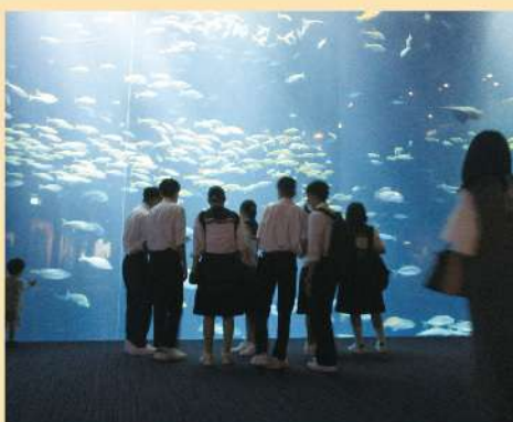
水族館班列行動(おおい町立名田庄中学校 R4)