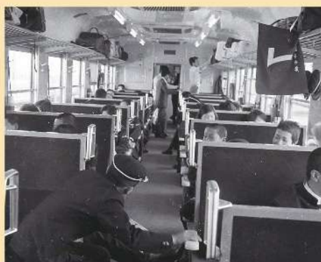
集約列車の中(坂井市立丸岡中学校 S46)

今回の企画展では、明治時代から現代まで、福井の児童・生徒が体験した修学旅行についてご紹介します。