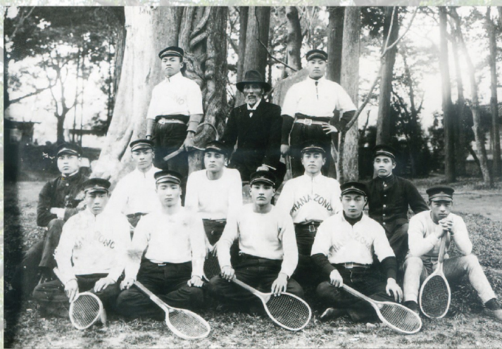
テニス部員と集合写真(花園学院) 大正期