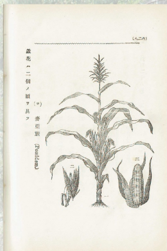
「植物学教科書」 松村任三著 平瀬画 1893(明治26年)