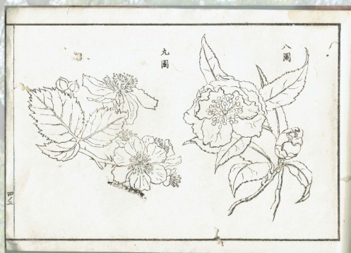
平瀬が初めて著した図画教科書 「画学初歩」第三・第四級 1878(明治11年)