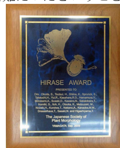
図6 平瀬賞の盾 (東山哲也氏所蔵)

以上のように、現在植物学の世界で、平瀬の発見を「絵描きによる偶然の発見」などと評価する者は皆無である。当然のことだが、現在では、国内においても平瀬の功績は世界的な偉業として正当に評価されている。